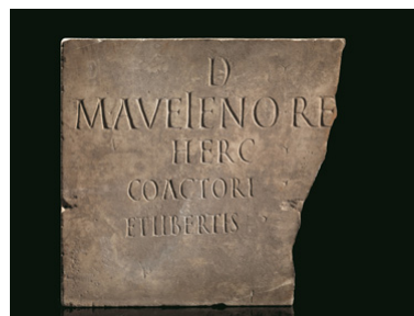
EPIGRAFE DI UN BANDITORE D'ASTA TIVOLI, I-II SECOLO d.C.