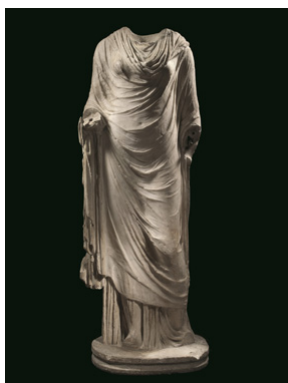
FIGURA FEMMINILE CON ABITO CERIMONIALE ROMA, I SECOLO d.C.

Le opere, secondo quanto affermato dal curatore della raccolta di arte classica degli Uffizi, Fabrizio Paolucci, “... presentano una qualità formale e un interesse storico che le rendono pienamente degne di figurare fra i migliori marmi già esposti ”. Queste parole, e sapere che queste preziose testimonianze del passato saranno ammirate dagli oltre quattro milioni di visitatori annui degli Uffizi, sono motivo di grande orgoglio per la nostra casa d’aste.